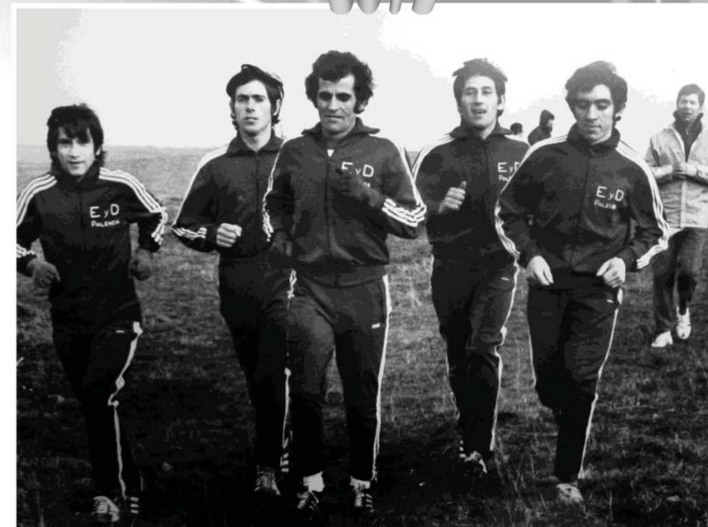
Equipo Educación y Descanso de Palencia, Campeones de Europa 1975 y 1976.